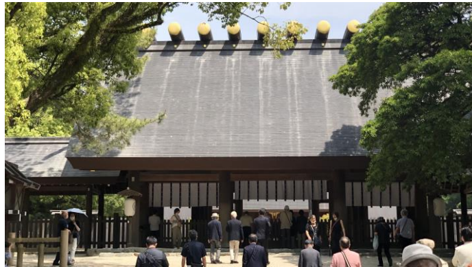
のパワースポットがある事で有名