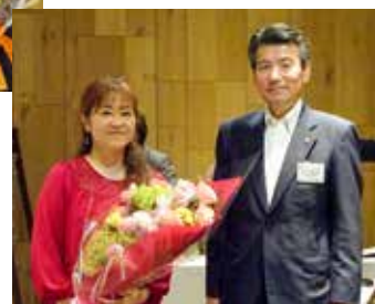
パッソ・ノヴィータスタッフ 事務局