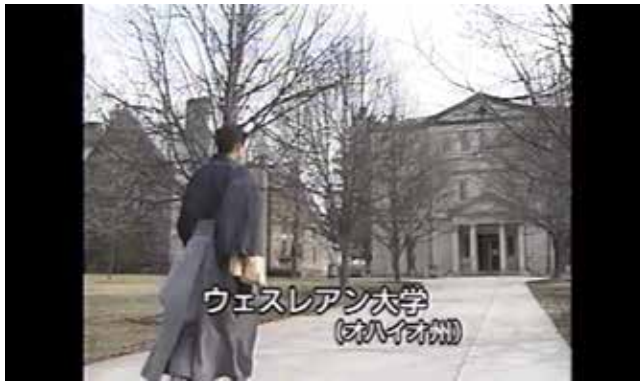
ウェスレアン大学 (オハイオ州)