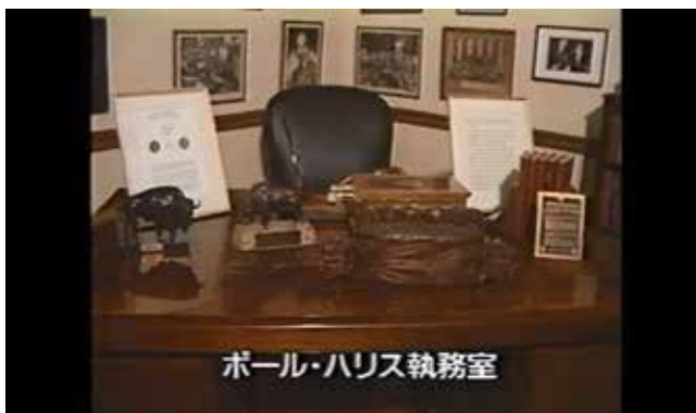
ポール・ハリス執務室