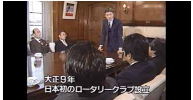
大正9年 日本初のロータリークラブ設立