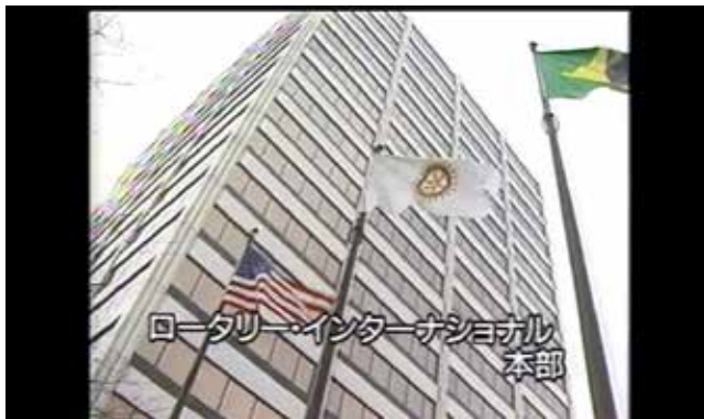
ロータリー・インターナショナル 本部